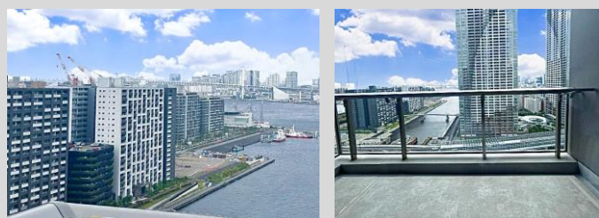
バルコニーからの眺望(レインボーブリッジ方面)